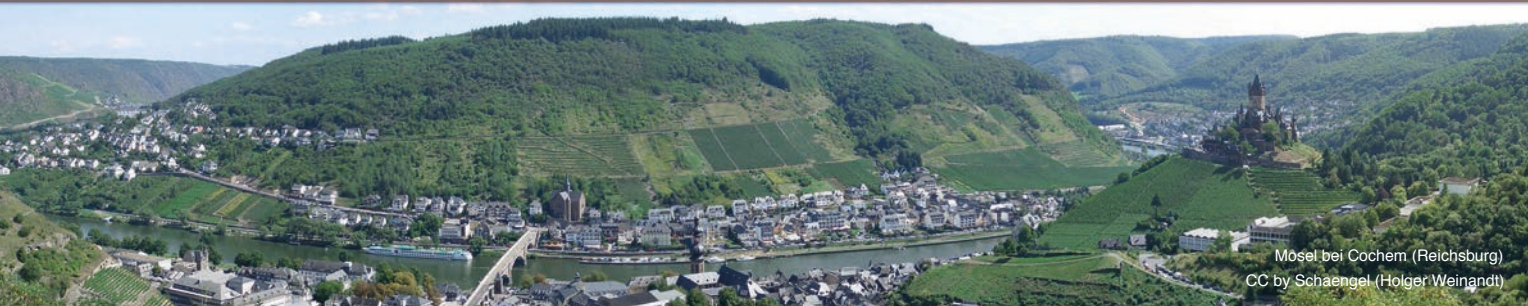
Mosel bei Cochem (Reichsburg)