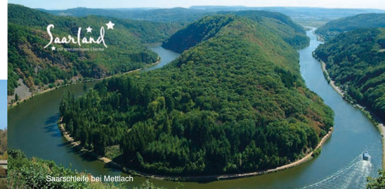
Saarschleife bei Mettlach

Wir sind Mitglied im LBH Linssen Boating Holiday Verbund. Erkundigen Sie sich über Ihre Vorteile in diesem einzigartigen und starken europäischen Charternetzwerk.