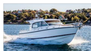
NIMBUS 365 COUPÉ