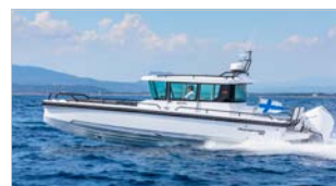
AXOPAR 28 CABIN MIT WETBAR