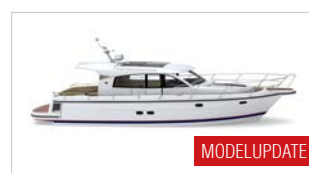
NIMBUS 405 COUPÉ