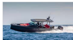
BRABUS SHADOW 800