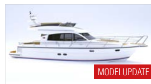
NIMBUS 405 FLYBRIDGE