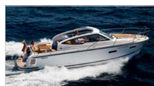
NIMBUS 305 DROPHEAD