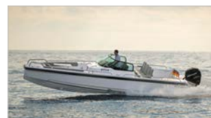
AXOPAR 28 OPEN