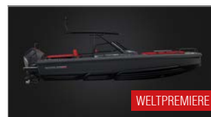
BRABUS SHADOW XXX