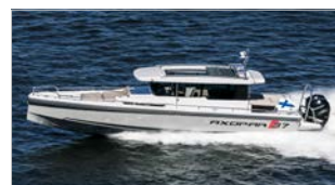
AXOPAR 37 CABIN