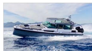
AXOPAR 37 SC