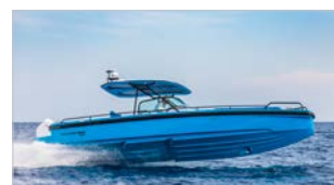
AXOPAR 28 T-TOP BRABUS-LINE