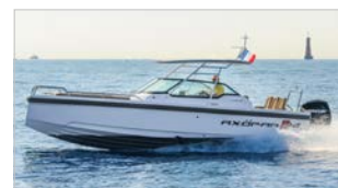
AXOPAR 24 T-TOP