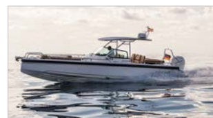
AXOPAR 28 T-TOP