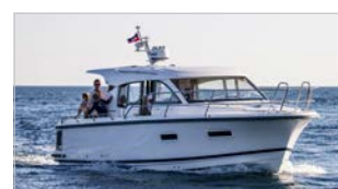
NIMBUS 305 COUPÉ