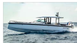
AXOPAR 37 SUN-TOP