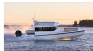
AXOPAR 28 CABIN MIT AFTCABIN